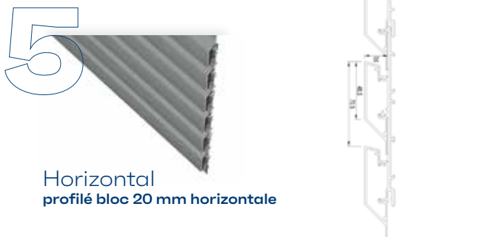
Horizontal profilé bloc 20 mm horizontale