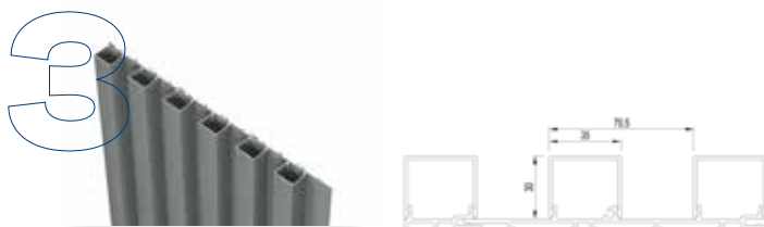
Mid profilé bloc 30 mm verticale