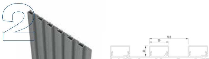
Low profilé bloc 20 mm verticale