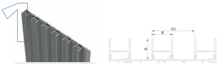
Fin profilé en U 30 mm verticale